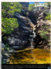
Espaço em Revista