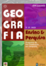
Geografia Ensino e Pesquisa